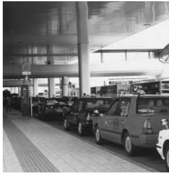
乗客待ちのタクシー

一、これまで実施した事業の技術的成果や集積について統括しているか、また、統括部署はあるのか、②新規事業・開発等はどう反映しているか。 二、技術プロジェクト部署設置