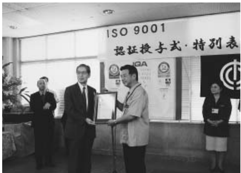
ISO9001 認証授与 (平成 14年 7月 25日)

二、本市は、ペイオフ対策連絡会議を発足させて、定期預金と借入金との相殺を中心とする対策をとりまとめた。最近の経済状況を踏まえて、去る九月五日金融審議会では、無利子の決裁性預金の全額保護の恒久化を提起した。全面解