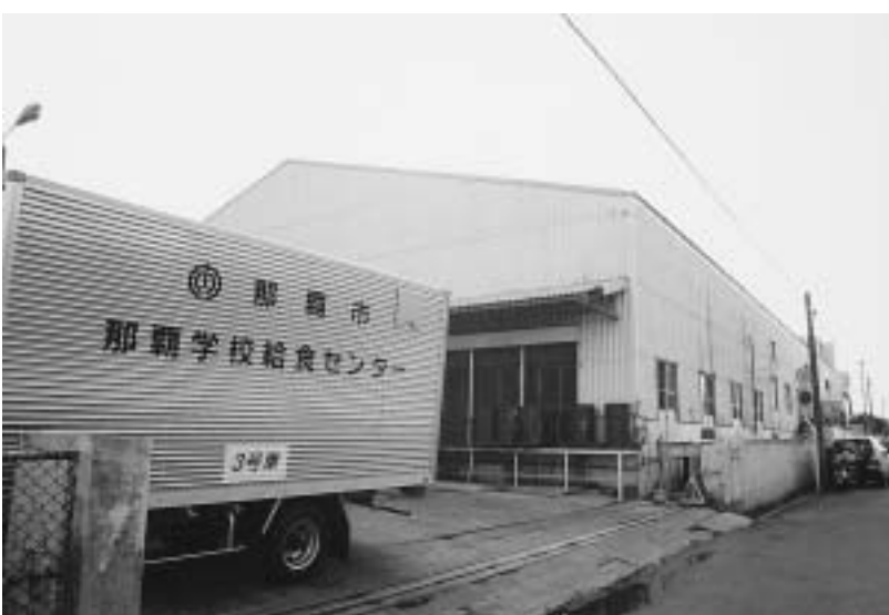
那覇給食センター

療保険制度の改革では、三歳未満児の自己負担が三割から二割の負担に軽減されている。三歳から六歳未満児までは、従来どおり三割の自己負担となっている。三歳未満児までの負担軽減に伴い、当初予算から不用と見込まれる財源の一部を活用して、乳幼児医療費助成対象者の拡大を図りたいと考えているが、当面三歳から五歳未満児の入院まで拡大することとし、六歳未満児までの拡大については、今後の状況を見ながら、関係部局と調整の上、検討していきたいと考えている。