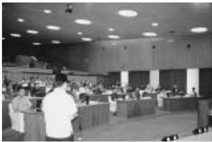
結成総会で、選出された役員は次のとおりです。

二十五日の最終本会議終了後に議員全員からなる「那覇市議会旧軍飛行場用地解決促進議員連盟」を発足し、議場で結成総会を開きました。同連盟は、旧軍飛行場用地問題等について調査・研究するとともに、関係団体と連携をとることにし、早期解決の促進をめざすものです。