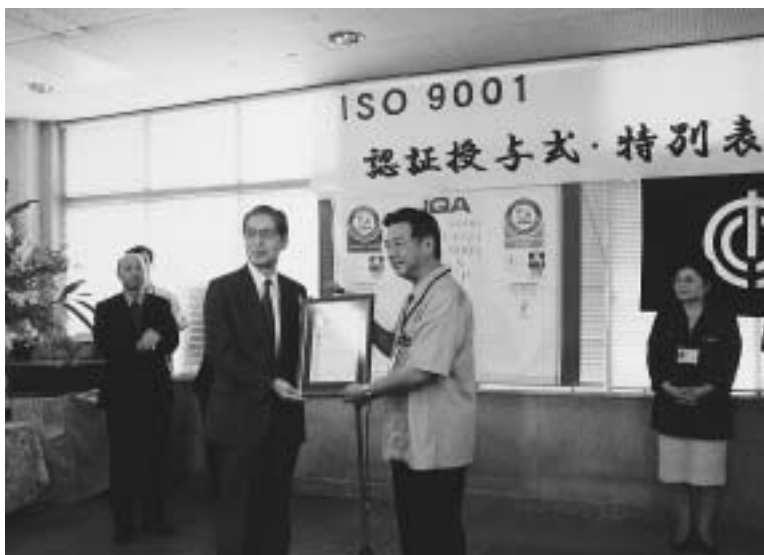
ISO9001 認証授与 (平成 14年 7月 25日)

今後経済状況の推移や個人市民税の総所得額をよりきめ細かく分析し、的確な調定見込みを計上するよう努力をしたい。意図的に隠して計上しなかつたということではない。